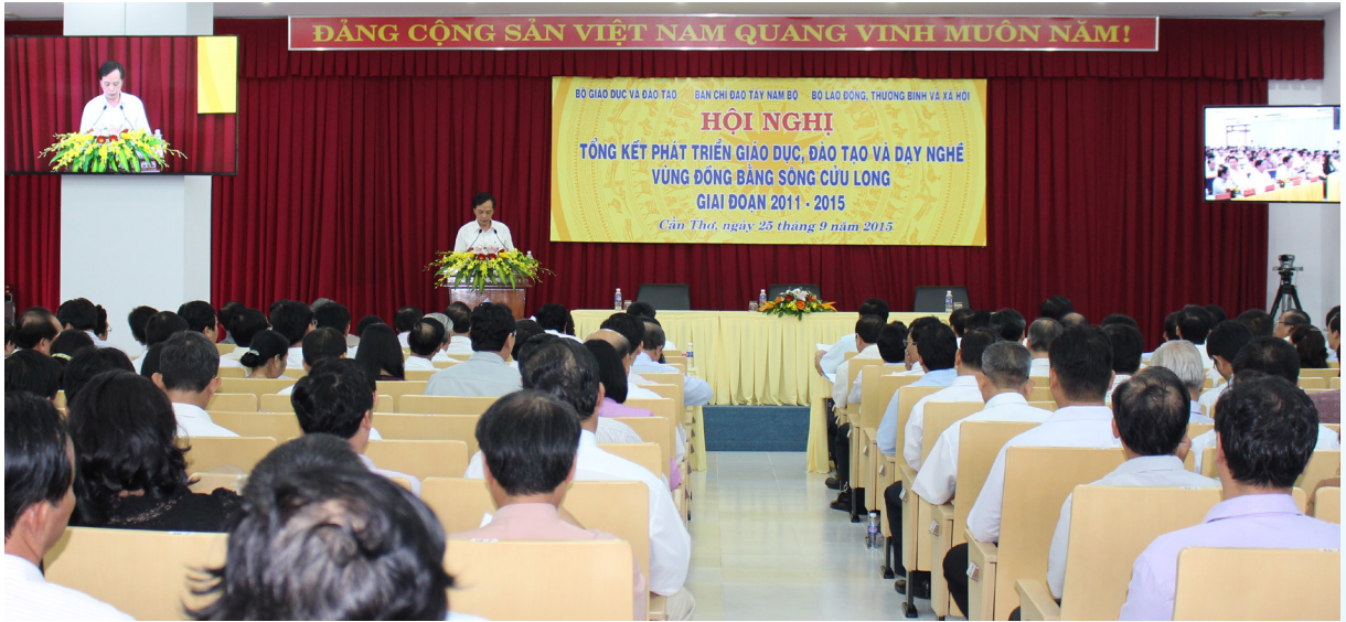
Hội nghị diễn ra tại Trường ĐHCT.

Ngày 25/9/2015, tại Trường Đại học Cần Thơ (ĐHCT) đã diễn ra Hội nghị đánh giá kết quả thực hiện Quyết định số 1033/QĐ-TTg của Thủ tướng Chính phủ về phát triển giáo dục, đào tạo và dạy nghề vùng Đồng bằng sông Cửu Long (ĐBSCL) giai đoạn 2011-2015.