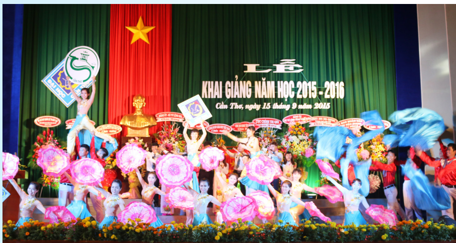
Tiết mục biểu diễn chào mừng Lễ Khai giảng.

Tại buổi Lễ Khai giảng, Trường ĐHCT vinh dự đón nhận Cờ thi đua của Chính phủ cho đơn vị hoàn thành xuất sắc, toàn diện nhiệm vụ công tác, dẫn đầu phong trào thi đua yêu nước năm 2013 của Bộ GD&ĐT; nhận danh hiệu "Tập thể lao động xuất sắc" năm học 2013-2014. Ngoài ra, Trường ĐHCT có 03 công chức, viên chức (CCVC) được Chủ tịch nước tặng thưởng Huân chương Lao động