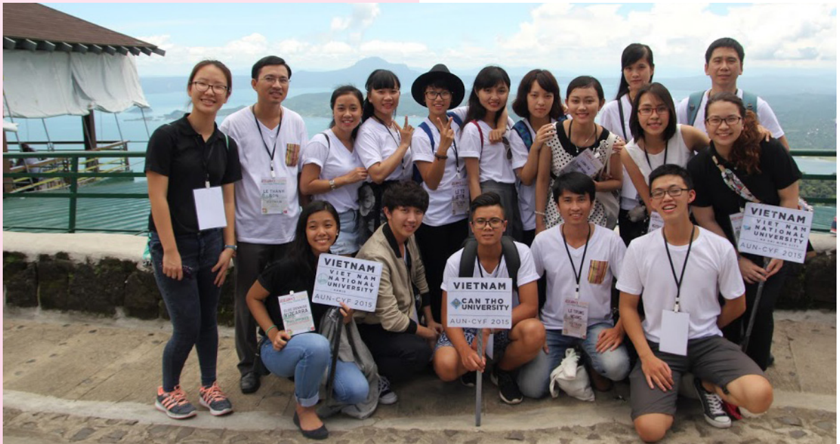
Ba trường từ Việt Nam chụp lưu niệm ở hồ núi lửa Tagaytay, Manila, Philippines.

Và hãy luôn tự hào vì chúng ta là người Việt Nam, là thanh niên, là công dân châu Á và hãy luôn phấn đấu vì một mục tiêu chung: ONE ASIA.