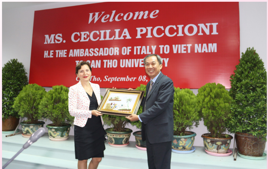
Đại diện hai bên trao quà và chụp ảnh lưu niệm.

Chuyến viếng thăm của Đoàn Đại sứ đã kết thúc tốt đẹp trong không khí cởi mở, hứa hẹn nhiều cơ hội hợp tác trong tương lai.