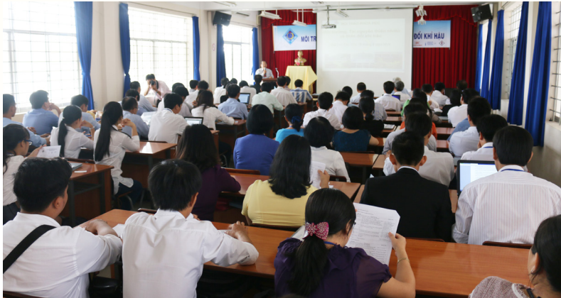
Hội thảo khoa học “Môi trường, Tài nguyên thiên nhiên và Biến đổi khí hậu” lần 2 tại Khoa MT&TNTN.

Ngày 25/9/2015, Hội thảo khoa học “Môi trường, Tài nguyên thiên nhiên và Biến đổi khí hậu” lần 2 tại Khoa Môi trường và Tài nguyên Thiên nhiên (MT&TNTN)-Trường Đại học Cần Thơ (ĐHCT) được tổ chức nhằm tổng kết các hoạt động, chia sẻ kết quả cũng như định hướng nghiên cứu khoa học về “Môi trường Tài nguyên thiên nhiên và Biến đổi khí hậu” của các nhà khoa học đang công tác tại Trường ĐHCT và các viện, trường trong và ngoài khu vực Đồng bằng sông Cửu Long (ĐBSCL).