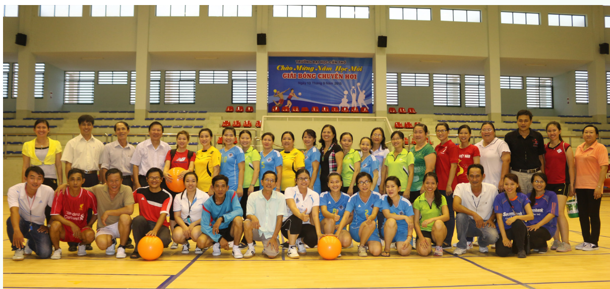
Ban Tổ chức cùng các VĐV chụp ảnh lưu niệm.

khoa, khối phòng ban, các đơn vị trực thuộc Trường. Tất cả các VĐV đã sẵn sàng cho trận đấu với quyết tâm cao và tinh thần "đoàn kết, trung thực, cao thượng". Sau một ngày thi đấu sôi nổi, với sự nỗ lực của từng cá nhân và đoàn kết trong đội, kết quả giải Nhất thuộc về đội Khoa Sư phạm, giải Nhì thuộc về đội Phòng ban và giải Ba thuộc về đội Khoa Công nghệ.