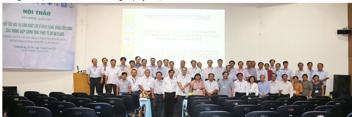
Ảnh lưu niệm tại Hội thảo.

Từ những kết quả đạt được của 06 hợp phần nghiên cứu của Dự án CLUES, các gói kỹ thuật được kỳ vọng sẽ cải thiện khả năng phục hồi tổng thể của hệ thống canh tác trên nền đất lúa của ĐBSCL nói chung và tại các tỉnh đã triển khai Dự án nói riêng (bao gồm An Giang, Bạc Liêu, Cần Thơ và Hậu Giang). Qua đó, thể hiện sự hợp tác giữa Trường ĐHCT và các đối tác quốc tế, các viện, trường tại Việt Nam và đối tác địa phương sẽ tiếp tục tăng cường và đẩy mạnh hơn nữa để cùng nhau phát triển cùng với vùng ĐBSCL trước những thách thức của BĐKH và nước biển dâng.