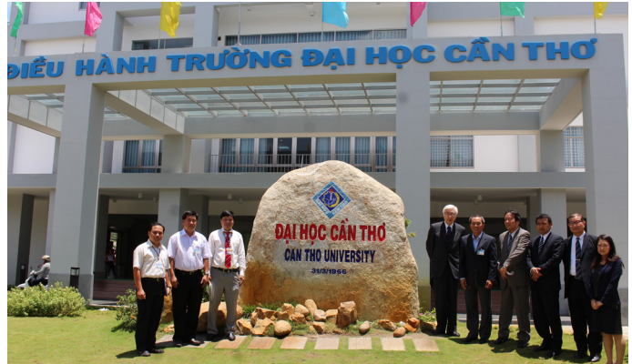
Đại diện hai Trường chụp ảnh lưu niệm.