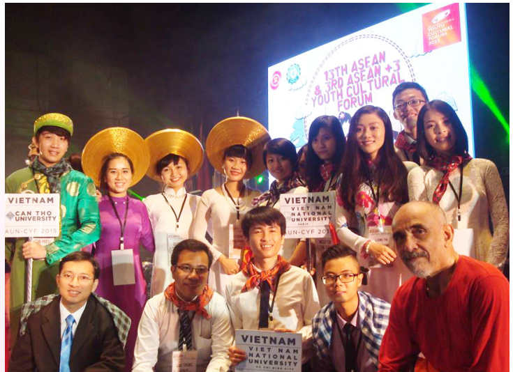
Đại biểu từ 3 trường của Việt Nam: Đại học Quốc gia Hà Nội, Đại học Quốc gia TP. Hồ Chí Minh và Đại học Cần Thơ.

hoạt động workshop. Mỗi đại biểu sẽ được lựa chọn để tham gia vào các nhóm khác nhau như: nhóm hát, nhóm học chơi nhạc cụ, nhóm kịch và nhóm múa. Trong đó nhóm múa được chia thành 03 nhóm nhỏ: điệu múa của dân tộc thiểu số, điệu múa lai Tây Ban Nha và múa truyền thống đạo Hồi. Tất cả các hoạt động trên đều rất thú vị vì các đại biểu sẽ được học với những giáo viên có kinh nghiệm lâu năm và là những người nổi tiếng của từng mảng. Kết thúc một ngày học, tất cả các đại biểu được dàn dựng kết hợp với nhau thành các tiết mục hết sức độc đáo biểu diễn trong Lễ Bế mạc của diễn đàn.