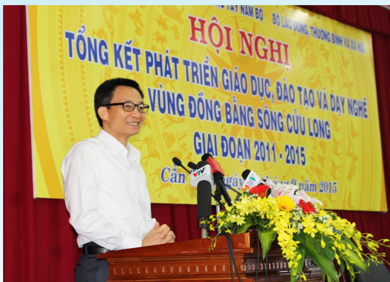
Phó Thủ tướng Chính phủ Vũ Đức Đam phát biểu chỉ đạo tại Hội nghị.

Tuy nhiên, bên cạnh những thành tựu đạt được thì so với mục tiêu của Quyết định 1033 vẫn còn một số chỉ tiêu phát triển dạy nghề trong vùng không đạt như: số trường cao đẳng dạy nghề đạt 78% (17/22 trường), số trường trung cấp nghề đạt 97,14% (34/35 trường); quy mô tuyển sinh dạy nghề bình quân hằng năm trong giai đoạn 2011-2015 chỉ đạt 56% và tuyển sinh học nghề trình độ cao đẳng nghề, trung cấp nghề còn thấp (5 năm qua mới đạt 7% tổng số học sinh học nghề), mới chỉ tập trung vào trình độ sơ cấp nghề và dạy nghề dưới 3 tháng; tỉ lệ lao động qua đào tạo nghề của vùng năm 2015 ước đạt 35,2%, đã tăng so với năm 2010 (23,5%) nhưng còn thấp so với bình quân cả nước (40,6%) và có sự chênh lệch lớn giữa các tỉnh trong vùng.