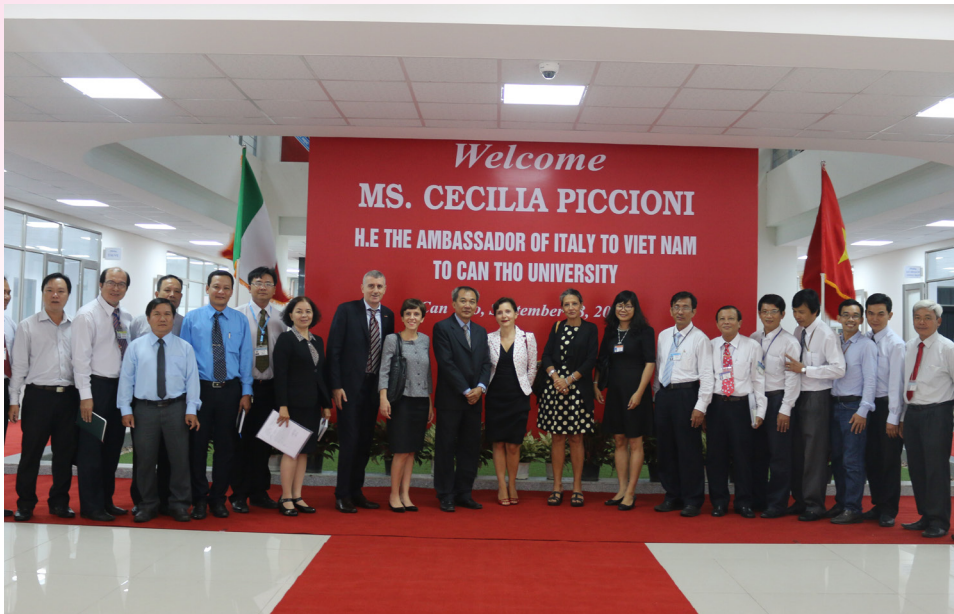
Ảnh lưu niệm giữa Trường và Đoàn Đại sứ Italia tại Việt Nam.