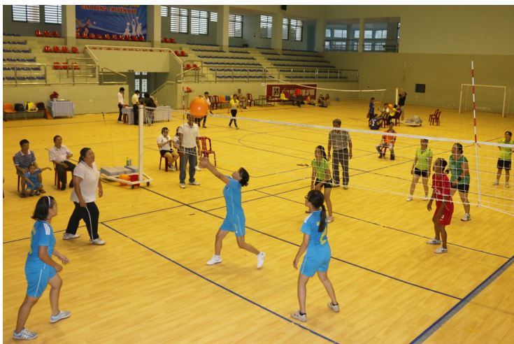
Trận đấu tranh giải nhất giữa đội Khoa Sư phạm và Khối phòng ban.

Chương trình khai mạc có sự tham dự của lãnh đạo Nhà trường và đại diện lãnh đạo các Khoa, viện, phòng ban, và đặc biệt không thể thiếu sự góp mặt của 12 đội bóng đến từ các