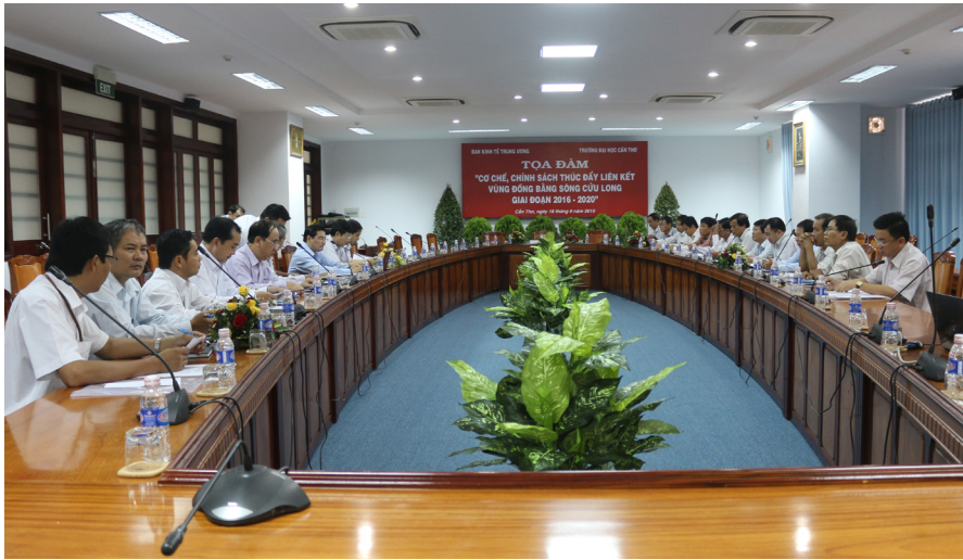
Tọa đàm với Ban Kinh tế Trung ương về liên kết vùng ĐBSCL giai đoạn 2016-2020.