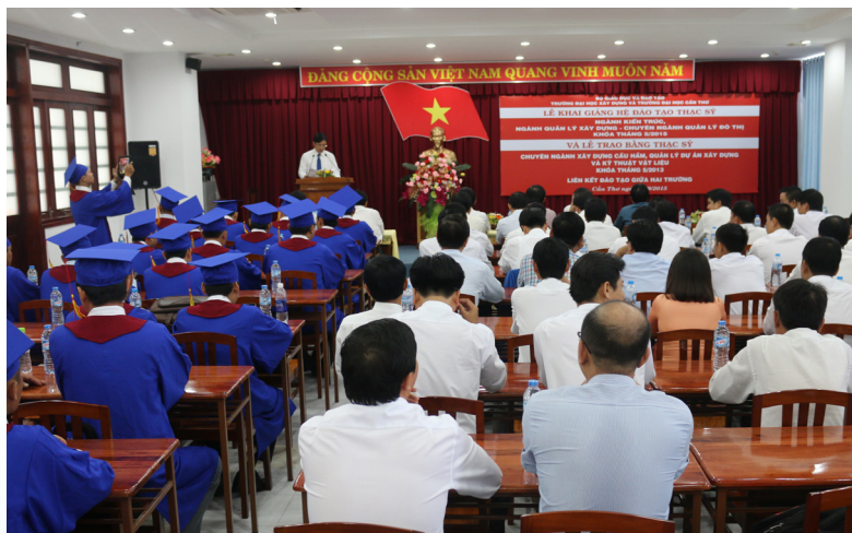
Lễ Khai giảng và Trao bằng Thạc sĩ liên kết đào tạo giữa Trường Đại học Xây dựng và Trường ĐHTC diễn ra tại Nhà Điều hành Trường ĐHTC.

Ngày 13/9/2015, Trường Đại học Xây dựng và Trường Đại học Cần Thơ (ĐHCT) đã long trọng tổ chức Lễ Khai giảng các lớp Thạc sĩ tháng 5/2015 và Trao bằng Thạc sĩ cho các học viên tháng 5/2013 thuộc các ngành liên kết đào tạo giữa hai trường.