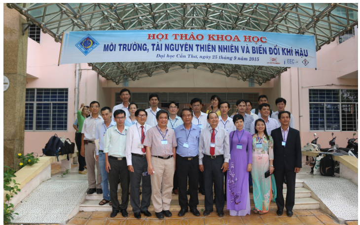
Đại biểu chụp ảnh lưu niệm.

thông tin, phương pháp nghiên cứu, cũng như chia sẻ kinh nghiệm tổ chức; phối hợp xây dựng và thực hiện các dự án, chương trình nghiên cứu mang tính liên ngành và việc ứng dụng thành quả nghiên cứu trong các lĩnh vực về môi trường thuộc các địa bàn khác nhau ở ĐBSCL nói riêng và cả nước nói chung.