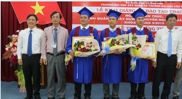
03 tân Thạc sĩ được khen thưởng vì có thành tích cao trong học tập và nghiên cứu.

chuyên ngành về xây dựng. Trên cơ sở thành công bước đầu từ sự liên kết giữa hai trường trong những năm vừa qua, Trường ĐHTC cam kết sẽ tăng cường phối hợp chặt chẽ hơn nữa với Trường Đại học Xây dựng nhằm tạo điều kiện tốt nhất để các học viên được học tập, rèn luyện và nghiên cứu tại Trường ĐHTC trong thời gian tới.