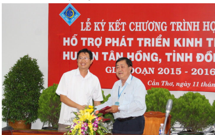
Đại diện các bên tiến hành ký kết hợp tác dưới sự chứng kiến của các thành viên tham dự.