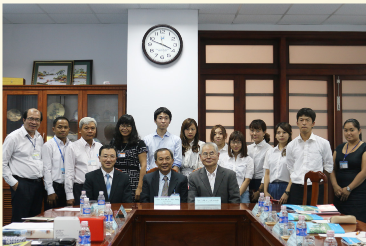
Ảnh lưu niệm với Đoàn Đại học Ritsumeikan.