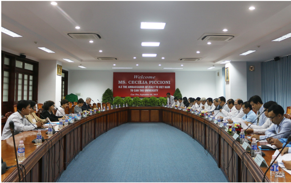
Toàn cảnh buổi đón tiếp và làm việc với Đoàn đại sứ.

tạo và nhiệt huyết đáp ứng nhu cầu nhân lực trong và ngoài nước. Tuy nhiên, ban lãnh đạo mong muốn đẩy mạnh hơn nữa hợp tác giáo dục với các đối tác nước ngoài nhằm nâng cao chất lượng nguồn nhân lực góp phần vào sự phát triển chung của các đơn vị. Trong đó, giáo dục Italia là một môi trường mới và đầy tiềm năng mà Trường ĐHCT đang muốn tiếp cận.