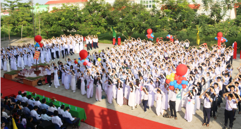
Đại gia đình Trường THPT Thực hành Sư phạm-Trường ĐHCN nô nức chào đón năm học mới.

Mùa hè năm 2015 vừa khép lại cũng là lúc mở đầu cho năm học mới 2015-2016, hòa trong không khí tươi vui đó, sáng ngày 5/9/2015, đại gia đình Trường THPT Thực hành Sư phạm-Trường Đại học Cần Thơ (ĐHCN) long trọng tổ chức lễ khai giảng năm học mới trong không khí tưng bừng và phấn khởi.