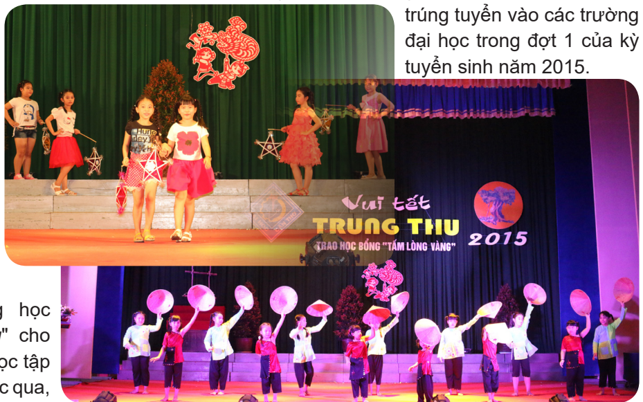
Các tiết mục văn nghệ đặc sắc trong chương trình.

sinh giỏi, trong đó, 35 em đạt danh hiệu học sinh giỏi cấp thành phố, 10 em đạt danh hiệu học sinh giỏi cấp quốc gia và đặc biệt, có 32 em trúng tuyển vào các trường đại học trong đợt 1 của kỳ tuyển sinh năm 2015.